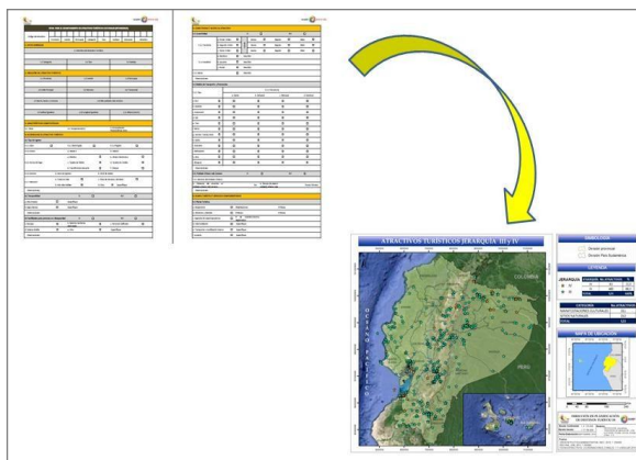
Gráfico 1. Sistematización de la ficha

Elaboración: Dirección de Productos y Destino, 2017.